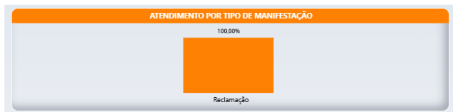
Relatório Ouvidoria 2026

O Canal da Ouvidoria registra atendimentos de Reclamação, Denúncia, Elogio, Sugestão e Crítica, e no período monitorado apresentou os percentuais abaixo descritos: